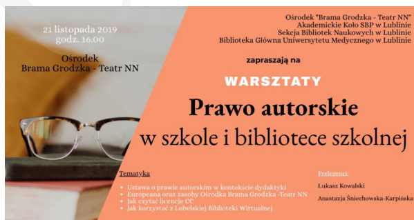
Fot. 5. Zaproszenie na warsztaty „Prawo autorskie”.

6. „Prawo autorskie w szkole i bibliotece szkolnej” – warsztaty odbyły się 21 listopada 2019 r. w godz. 16.00–18.00. Organizatorami byli: Teatr NN Ośrodek Brama Grodzka, Akademickie Koło SBP w Lublinie, Sekcja Bibliotek Naukowych SBP Oddział Lublin, Biblioteka Główna Uniwersytetu Medycznego w Lublinie. Warsztaty zgromadziły 37 uczestników (fot. 5).