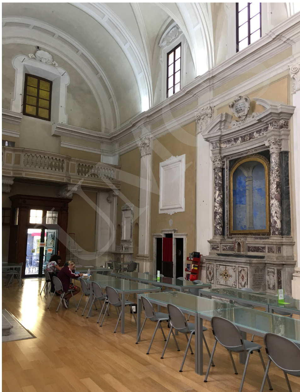
Fot. 3. Czytelnia biblioteki POLO 6, fot. Ewa Rzeska.

W trzecim dniu pobytu zwiedziłyśmy bibliotekę POLO 4 (Biblioteka Medyczna), znajdującą się w pobliżu szpitala klinicznego. Zapoznaliśmy się z e-zasobami biblioteki (bazy danych, e-czasopisma, e-książki) oraz tworzonymi przez Bibliotekę