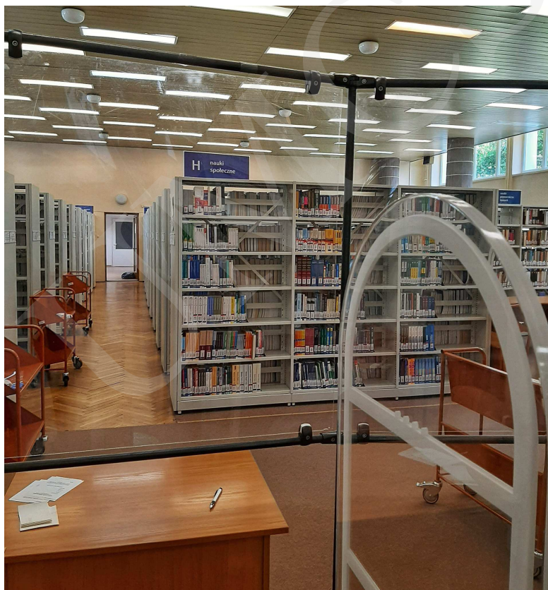
Fot. 2. Czytelnia 1 Wolnego Dostępu na parterze budynku Biblioteki UMCS.