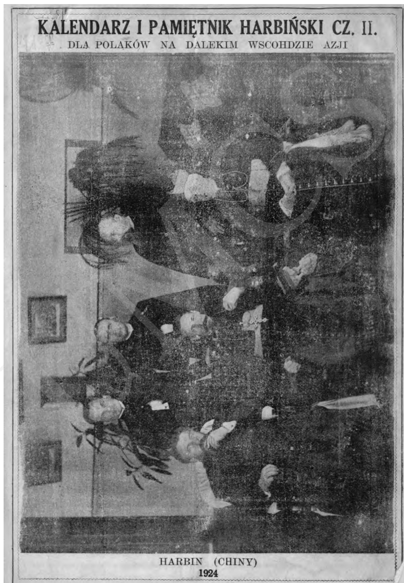
Fot. 3.

Żaden spis czasopism harbińskich, jak również bardzo wyczerpująca bibliografia Adama Winiarza nie wymieniają pozycji „Kalendarz dla Polaków na Dalekim Wschodzie”, „Kalendarz dla Polaków na Dalekim Wschodzie i Pamiętnik Charbiński” czy „Kalendarz i Pamiętnik Harbiński dla Polaków na Dalekim Wschodzie Azji”, stąd nie sposób obecnie stwierdzić, skąd wynikały różnice w poszczególnych wydaniach.