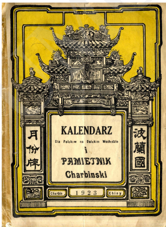
Fot. 1. 1923.

Badając zasoby poszczególnych bibliotek, można zauważyć, że istnieją edycje „Pamiętnika Harbińskiego” różniące się, aczkolwiek nieznacznie, treścią i formą wydawniczą. Przykładowo w zbiorach Biblioteki Uniwersyteckiej im. Jerzego Giedroycia w Białymstoku (online w Podlaskiej Bibliotece Cyfrowej) 36 znajduje się egzemplarz „Pamiętnika” z 1923 roku, posiadający kartę tytułową z wyobrażeniem chińskiej pagody i napisem „Kalendarz dla Polaków na Dalekim Wschodzie i Pamiętnik Charbiński” (fot. 1).