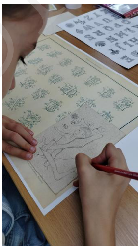
Fot. 9. Precyzyjne szkicowanie projektu, fot. A. Mikulska.

Warsztaty cieszyły się dużym zainteresowaniem, a uczniowie we wszystkich grupach wiekowych wykazali się zaangażowaniem podczas realizacji zadań, korzystając z wiedzy uzyskanej podczas części wprowadzającej. Młodszy uczestnicy pomimo wyższego stopnia trudności związanego z początkami nauki pisania wyróżniali się dużą kreatywnością. Praca dzieci przebiegała dwutorowo – część uczniów skoncentrowała się na pierwszym etapie projektowania inicjału i tworzeniu szkicu, starając się zagospodarować całą powierzchnię kartki i wielokrotnie nanosząc poprawki. Wśród pozostałych „iluminatorów” w akcie twórczym dominowała spontaniczność i odważna ekspresja przy zastosowaniu łączonych materiałów, jak farby, brokat, elementy dekoracyjne. We wszystkich grupach wiekowych ważnym czynnikiem okazało się wskazywanie etapów pracy oraz określanie ram czasowych dla poszczególnych części zadania. Pomocą metodyczną dla prowadzących stanowił plan pracy w formie opracowanego autorskiego scenariusza zajęć, jako punkt odniesienia pomocny przy moderowaniu działań uczniów. Przewidywany czas zajęć wynosił 60 minut, co wymuszało intensywne tempo pracy, wydawało się jednak optymalne z uwagi na możliwości utrzymania uwagi całej grupy.