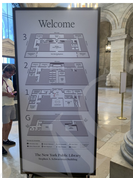
Fot. 2. Plan zwiedzania Biblioteki, fot. A. Strumińska.