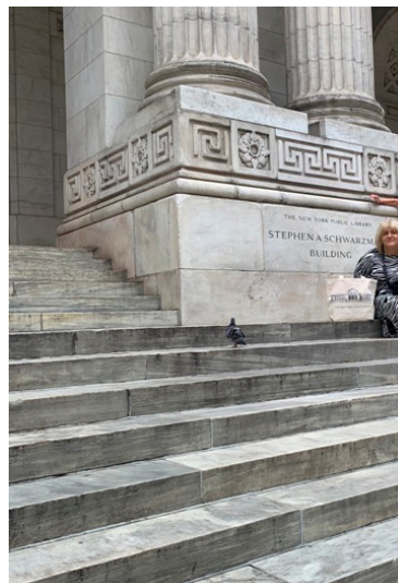
Fot. 1. The New York Library, fot. A. Strumińska.