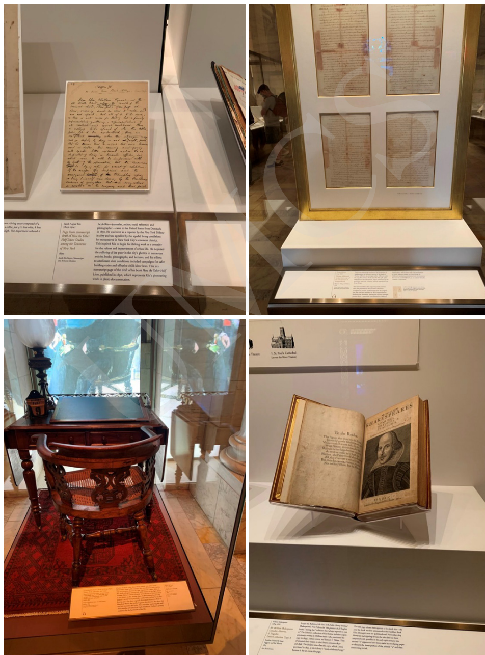
Fot. 6. Zbiory Nowojorskiej Biblioteki, fot. A. Strumińska.

W zbiorach Nowojorskiej Biblioteki Publicznej znajduje się wiele cennych dzieł, takich jak: Biblia Guttenberga czy rękopis Deklaracji Niepodległości napisany przez