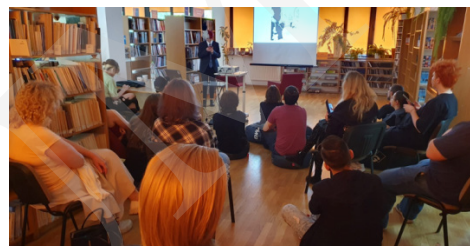
Fot. 4. Spotkania z mangą i anime.