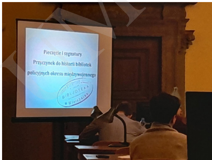
Fot. 10. Prezentacja jednego z wystąpień.