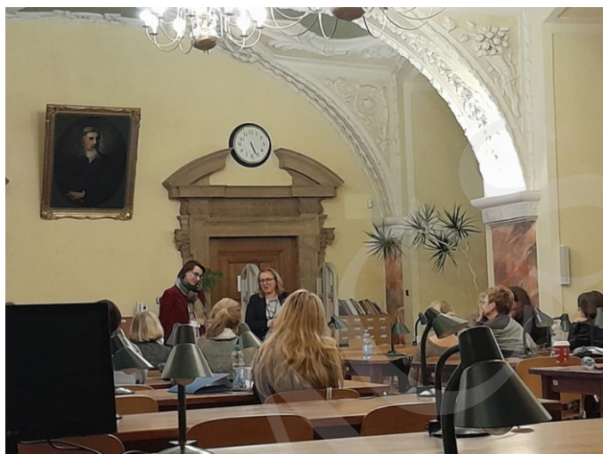
Fot. 11. Prezentacja jednego z wystąpień.