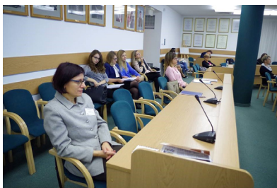
Ryc. 7. Słuchacze sekcji A.