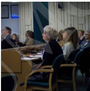
Ryc. 4–6. Pierwszy dzień obrad.