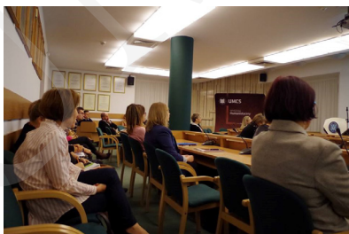
Ryc. 8. Słuchacze podczas sesji drugiej.