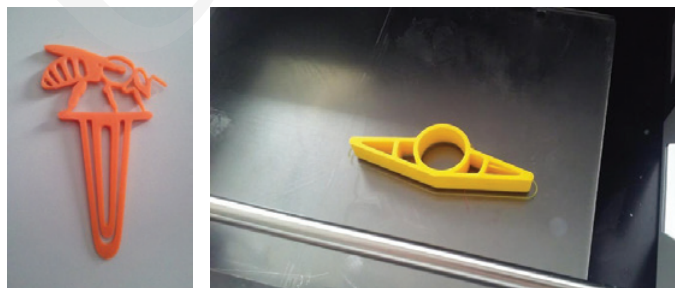
Fot. 5. Wydrukowane przedmioty, fot. Lidia Jarska.

Po zakończeniu pracy wskazane jest, by wydruk pozostał przez kilkadziesiąt sekund na stole do ostygnięcia. Po tym czasie za pomocą szpachelki odrywamy przedmiot. Powstałą rzecz można jeszcze delikatnie wyszlifować papierem ściernym tak, by jej powierzchnia była gładsza.