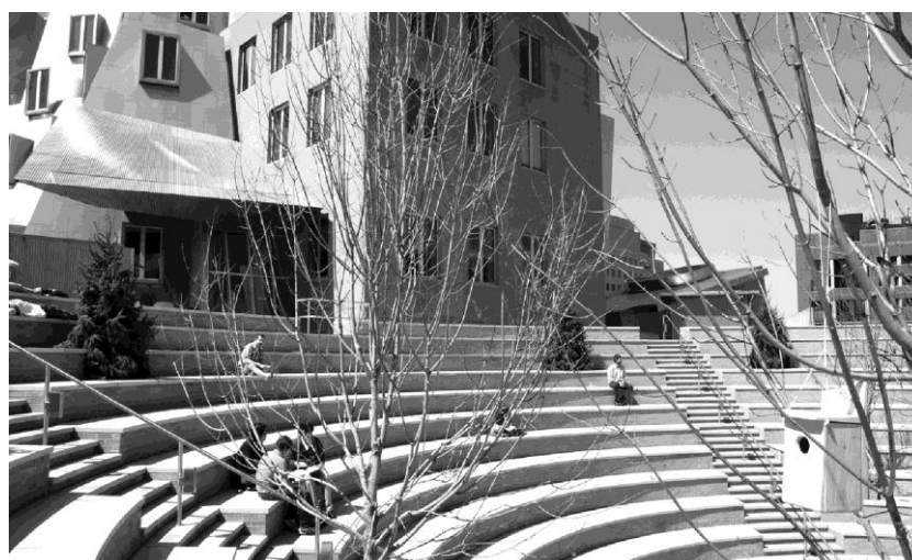
Rys. 4. Przestrzeń integracyjna na przykładzie projektu Fritza Haega w ramach cyklu Animal Estates (ANIMAL ESTATE regional model homes 3.0). Program dla miasta Cambridge, Massachusetts. Komisarz wystawy – Center for Advanced Visual Studies at MIT, kwiecień 2008.[7] autor: Frith Haeg.

zmiany sposobu użytkowania przestrzennego, w których powstają przestrzenie o mieszanym przeznaczeniu (są więc bardziej konfliktogenne z racji różnych praw własności) lub miejsca łączenia funkcji o charakterze liniowym i plamowym, jak parki z ciągami zieleni rekreacyjnej. Bardzo często zagospodarowuje się w ten sposób nieużytki miejskie, czyli miejsca posiadające prawnego właściciela, lecz celowo pozostawione w stanie niezagospodarowanym, a wykorzystywane biernie, np. pasy zieleni izolacyjnej, ochronnej itp.