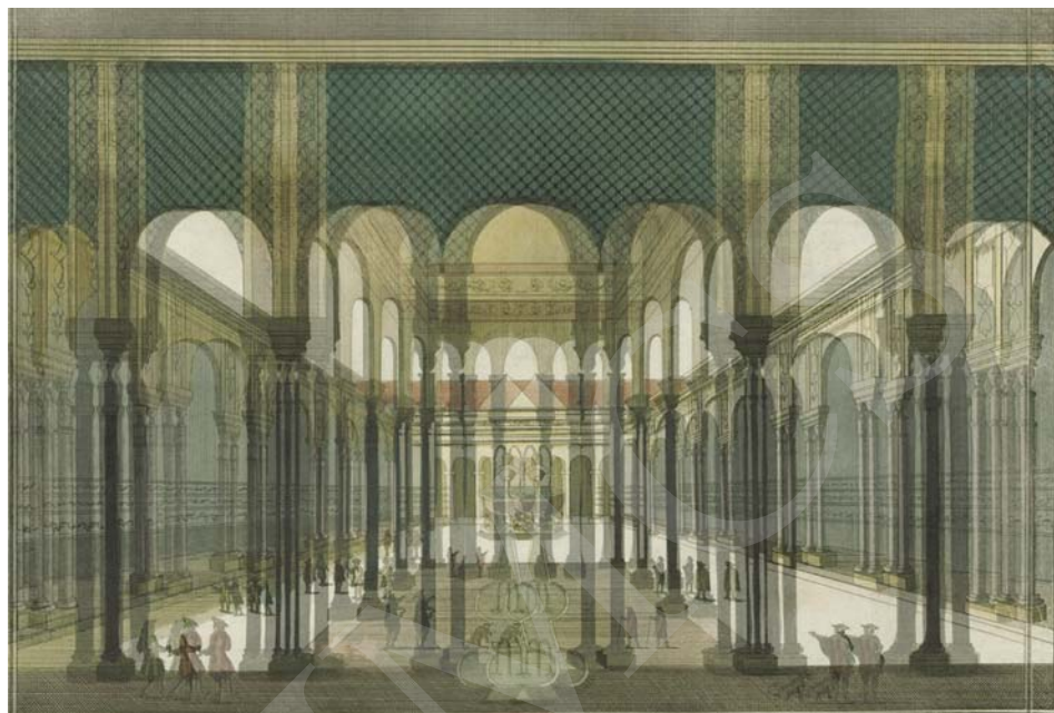
Ilustracja 9. Komputerowa symulacja działania podwójnego pryzmatu, z symultanicznie nałożonymi na siebie obrazami odchyłonymi horyzontalnie przez dwa przeciwnie skierowane pryzmaty.

Termin stereopsis używany jest zwykle jako skrót pojęć: „widzenie obuoczne”, „binokularna percepcja głębi” lub „stereoskopowe postrzegania głębi”. Ale wrażenie głębi związane z mechanizmami stereopsis uzyskać można również w widzeniu jednoocznym, gdy obiekt obserwowany lub obserwator znajduje się w ruchu. Symulacje tego rodzaju wrażeń przestrzenności dostępne są również w zograscope , przy ruchach głowy obserwatora na boki. Przesłona otaczająca soczewkę zasłania boki grafiki, prowokując do zajrzenia, co się tam znajduje. I to jest ciekawe doświadczenie, bo nie tylko widzimy, że poza centralnym kadrem okulusa soczewki rzeczywiście jest jakiś dalszy ciąg przestrzeni, ale zmiana pozycji obserwatora powoduje dynamiczne zmiany w tym, co widzimy. Obrazoprzestrzeń vue d'optique animuje się, przesuując horyzontalnie w okulusie soczewki i jednocześnie obraca pozornie względem pionowej osi przedstawienia. Jest to doświadczenie bardzo sensoryczne, bo odnosimy wrażenie prawie fizycznej interakcji z wirtualną przestrzenią. Dużą rolę odgrywa tu zmiana położenia grafiki w stosunku do krawędzi okulusa ramki soczewki, względem pozycji obserwatora, co określa się jako ruch paralaksy 14 .