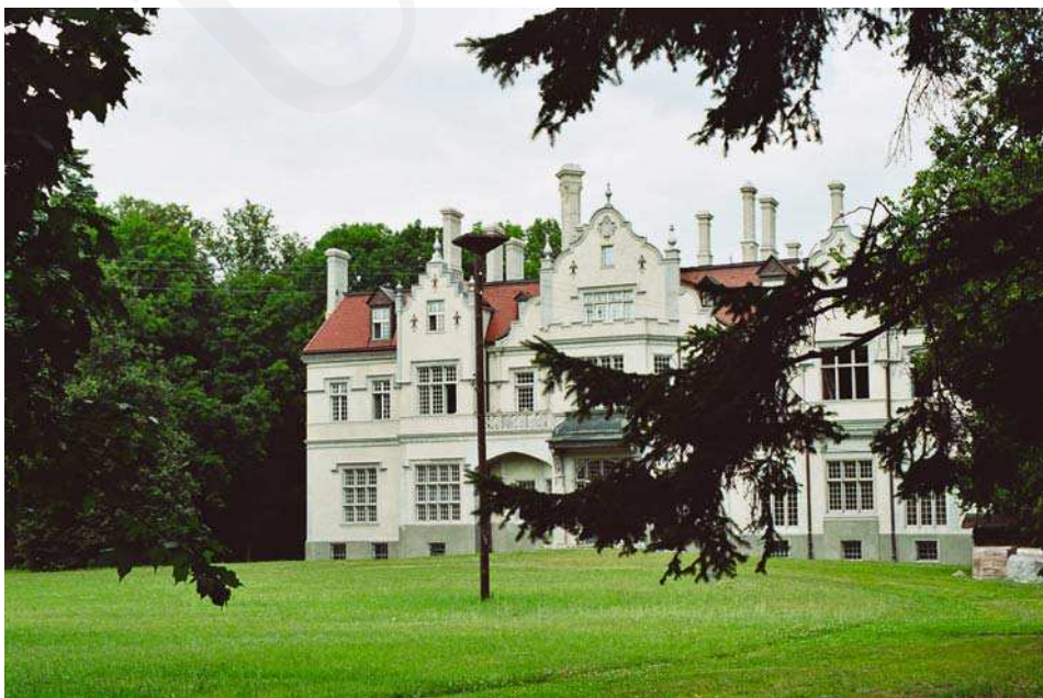
Il. 4. Pałac w Jabloniu, elewacja frontowa. lipiec 2005.