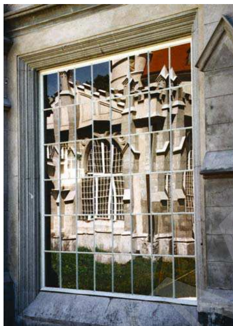
Il. 7. Pałac w Jabłoniu, okno w łączniku pomiędzy pałacem a oficyną. Fot. A. Cebulak, sierpień 2005.