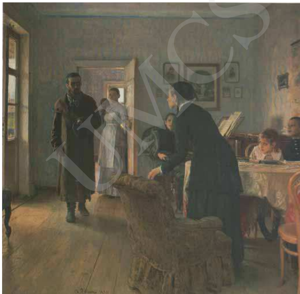
Ilustracja 1. Ilja Riepina, Nie żdali , 1884-1888, olej na płótnie, 160,5cm x 167,5cm.