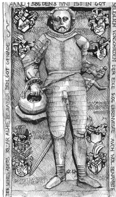
2. Nagrobek przed osobą Franza von Dyherrna, rys. autorstwa M. Kruszewskiej